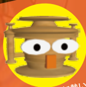
燃え盛るように熱い 日本古代史【Vルキー】