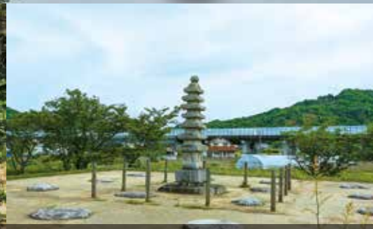
備前国分寺跡(赤磐市)

6世紀末築造の復元直径40m高さ10mの円墳全長18mの横穴式石室は巨大積石で作られ羨道周りには貴重なヒカリ藻が生息している。吉備津彦命の子孫とされる上道氏一族の墓か。