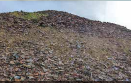
備前陶器伊部南大窯跡(備前市)

美しい二重周濠の中に築かれた全長203mの巨大前方後円墳。5世紀末、この大型古墳に葬られた人物は誰か。