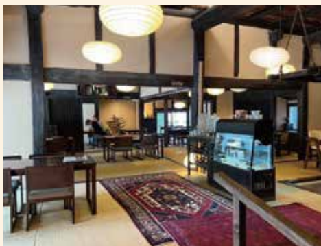
オカヤマガーデン「夢二茶屋 takatsuki」